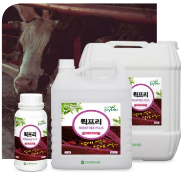
Sản phẩm khử mùi có hương thơm (Dạng lỏng 1L, 5L, 20L)

Sản phẩm khử mùi nồng độ cao thế hệ mới thân thiện với môi trường ,phân hủy nguồn gốc gây mùi bằng nước và cacbon đioxyt khi sử dụng trong môi trường đang bị ô nhiễm. Sản phẩm khô nhanh, không để lại đọng nước, không gây hại cho cơ thể người và động thực vật, không chỉ loại bỏ mùi khó chịu bằng hương thơm mà còn lưu lại mùi hương thoang thoảng.