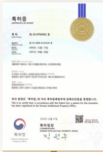
PATENT NO. 10-0764462

Chúng tôi sở hữu những bằng phát minh sáng chế về SILICA, đội ngũ nghiên cứu kỹ thuật có chuyên môn luôn không ngừng cố gắng trong phát triển kỹ thuật mới, sản phẩm mới về nông súc sản.