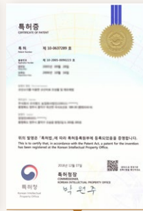
PATENT NO. 10-0637289