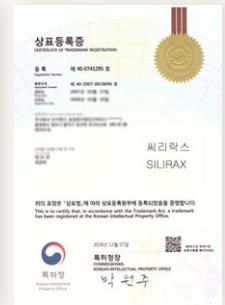
TRADEMARK REGISTRATION NO. 40-0741295