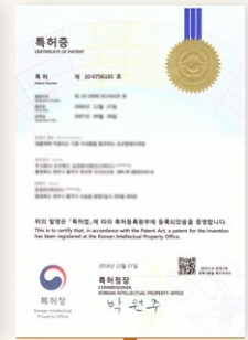
PATENT NO. 10-0756185