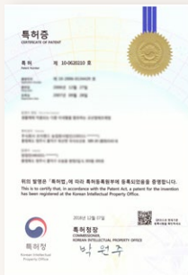
PATENT NO. 10-0620210