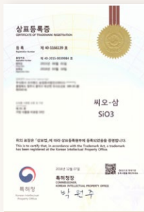
TRADEMARK REGISTRATION NO. 40-1166139