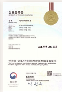
TRADEMARK REGISTRATION NO. 40-0412888