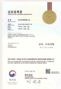
TRADEMARK REGISTRATION NO. 40-0681861