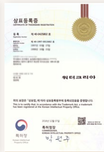
TRADEMARK REGISTRATION NO. 40-0425802