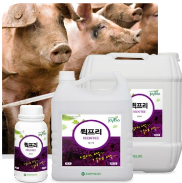
Sản phẩm khử mùi (Dạng lỏng 1L, 5L, 20L)

Sản phẩm khử mùi nồng độ cao thế hệ mới thân thiện với môi trường ,phân hủy nguồn gốc gây mùi bằng nước và cacbon đioxyt khi sử dụng trong môi trường đang bị ô nhiễm không để lại đọng nước, sản phẩm không gây hại cho cơ thể người và động thực vật.