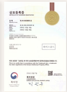
TRADEMARK REGISTRATION NO. 40-0650698