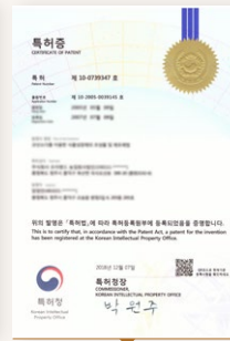
PATENT NO. 10-0739347