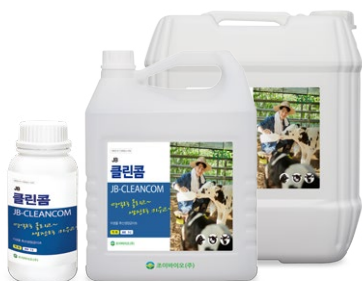
Nước tăng trưởng gia súc vi sinh vật (Dạng lỏng 1L, 5L, 20L)