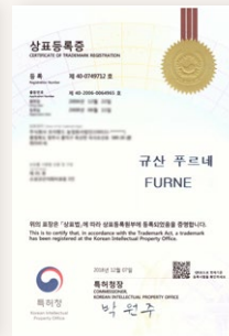
TRADEMARK REGISTRATION NO. 40-0749712